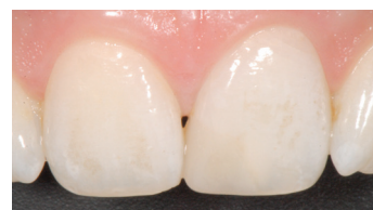
Pigmentazioni da fumo sui denti di paziente fumatrice.

» Le moderne otturazioni vengono eseguite con materiali compositi. Queste resine sono molto efficienti, ma negli anni vanno incontro a un naturale invecchiamento per cui diventano leggermente meno lucide e più porose. L'aumento di porosità si traduce nel paziente fumatore in una maggiore tendenza alle colorazioni. Nella pratica, le otturazioni diventano scure più velocemente e dovranno essere sostituite con più frequenza, soprattutto se fatte sui denti anteriori (Foto 3).