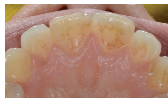
Stessa paziente, si osservano pigmentazioni da fumo sulla superficie interna dei denti