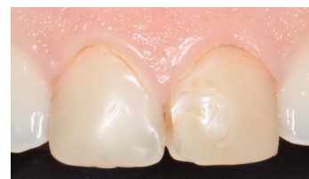
Restauri in composito con pigmentazioni su paziente fumatrice.

» Su tutto il territorio italiano sono distribuiti quasi 400 Centri antifumo . Le strategie per smettere sono molteplici e vengono adattate all'individuo passando dal counselling individuale, alla terapia di gruppo , e alla prescrizione di prodotti sostitutivi della nicotina o di farmaci per la disassuefazione, a seconda del caso. Tutte le informazioni relative ai Centri antifumo sono sul sito dell' Osservatorio fumo alcol e droga (OssFAD) dell'Istituto Superiore di Sanità o possono essere richieste al numero verde contro il fumo (800 554 088) dello stesso Istituto, che fornisce anche una consulenza su tutte le problematiche legate al tabagismo .