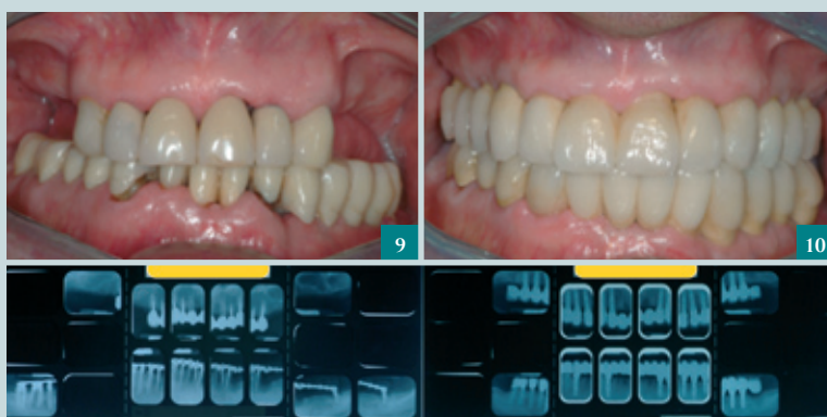
9-10. VISIONE PRE E POSTOPERATORIA DI RIABILITAZIONE COMPLESSA SU IMPIANTI E DENTI.

peutiche: si può prevedere una protesi fissa su impianti, spesso realizzata con funzione immediata o con l'impiego di chirurgia avanzata, come la chirurgia rigenerativa e le diverse tecniche di rialzo del seno, nelle situazioni di atrofie dei mascellari conseguenti alla perdita dei denti e delle malattie parodontali a essi collegate. In alcuni casi è possibile prevedere soluzioni di overdenture, cioè protesi mobili ancorate su due o più impianti, fino a protesi mobili totali, le cosiddette "dentiere", che nonostante abbiano diversi limiti, possono rappresentare una soluzione efficace ed economicamente sostenibile per molti pazienti. Esiste una soluzione preferibile? Non c'è una risposta univoca a questa domanda. Fondamentale è che il professionista informi il paziente circa le possibilità e i limiti delle singole soluzioni e, sulla base di considerazioni che tengono conto di aspetti clinici ed extraclinici, tra cui il profilo psicologico, le aspettative, oltre alle disponibilità economiche, sappia indicare il trattamento più appropriato. Naturalmente, qualunque soluzione si adotti, essa deve basarsi sull'evidenza scientifica ed essere eseguita sempre operando nel campo dell'eccellenza clinica. Per dirla con uno slogan: le soluzioni possono essere diverse, la qualità una sola.