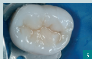
2-5. RESTAURO INDIRECTO IN COMPOSITO.

derivanti dalla letteratura con la propria esperienza clinica, allo scopo di definire gli obiettivi, le modalità e le eventuali opzioni di trattamento, dall'altra è sempre più evidente come egli debba rispettare le aspettative e le reali necessità del paziente oltre che considerarne gli aspetti psicologici, tra cui il grado di collaborazione, e quelli socioeconomici. In questo senso il clinico deve operare alla stesura e alla esecuzione del piano di trattamento non soltanto in termini di completezza, ma piuttosto di "appropriatezza". Ai fini del successo terapeutico, saper indicare il piano di trattamento appropriato per un paziente, e quindi a lui più adatto, è importante almeno quanto la corretta esecuzione delle diverse modalità di cura.