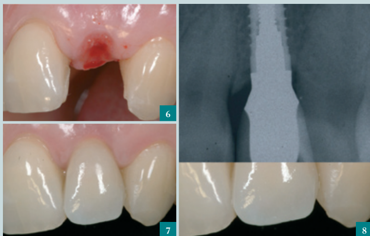
6-8. VISIONE PRE E POSTOPERATORIA DI INTERVENTO ESTETICO CON IMPIANTO E CORONA INTEGRALE IN CERAMICA.